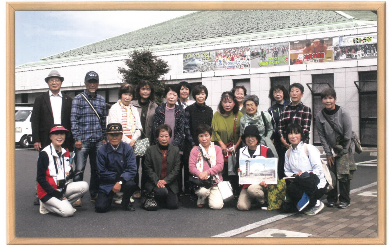
令和4年10月13日 西予市乙亥会館災害伝承展示室 見学研修にて

〒791-0211 愛媛県東温市見奈良490-1 電話 089-955-5535 FAX 089-955-5766