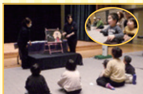
手作り紙芝居 「こわゆっこしましよ」