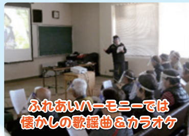
ふれあいハーモニーでは 懐かしの歌謡曲&カラオケ