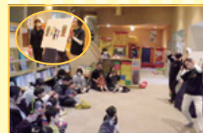
パネルシアター 「すまきなぼうしやさん」