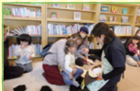
エブロンシアター 「カレーライスのおうた」

11月26日(日)えひめこどもの城で開催された『えひめ児童館ジャンボリー』に参加しました。県下各地の児童館が、遊びや体験のプログラムを持ち寄ってのイベントで、東温市こども館は「おはなしワールドプラス」と題して、大型絵本の読み聞かせや、パネルシアターの上映、音楽に合わせて「からだあそび」を行いました。