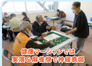
健康マージャンでは 実演&麻雀牌で神経衰弱