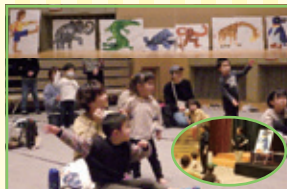
からだあそび 「エリックカーンできるかな」