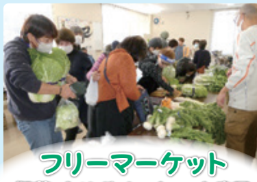
フリーマーケット 野菜・おはぎ・クッキー・お寿司 手芸品・不用品等、各種勢ぞろい