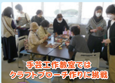
手芸工作教室では クラフトブローチ作りに挑戦