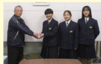
▲募金活動にご協力いただいた重信中学校の生徒さん