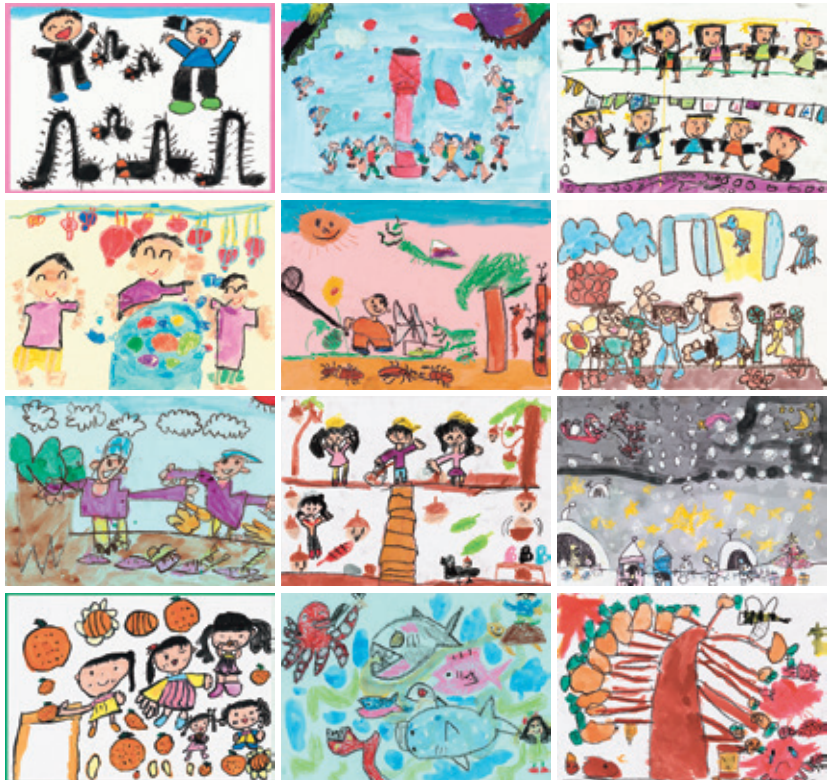
カレンダー掲載作品の一部です。

市内の幼稚園・保育所(園)の年長児の皆さんにご協力いただき、令和6年度版「ふれあいにこにこカレンダー」を作成しています。