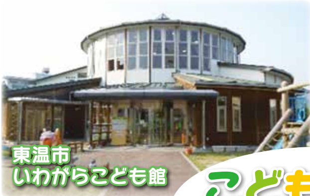
東温市 いわがらこども館