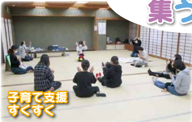
子育て支援 すくすく