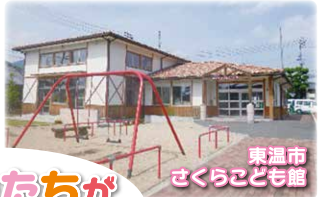
東温市 さくらこども館