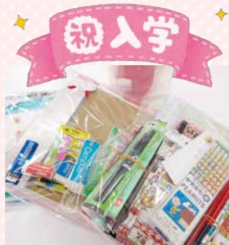
▲こちらは配付した文具セットの一部です。

ご協力いただいたアンケートは、より良い事業となるよう結果を参考にさせていただきます。