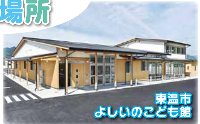
東温市 よしのこども館

東温市内には3館のこども館があり、こどもたちの居場所としていつもにぎわっています。こども館では毎月、それぞれの特徴を生かした、イベントも実施しています。（休館日：火曜日）