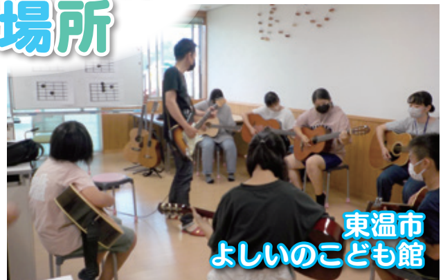
東温市 よしいのこども館

東温市内には3館のこども館があり、こどもたちの居場所としていつもにぎわっています。こども館では毎月、それぞれの特徴を生かした、イベントも実施しています。(休館日：火曜日・祝日)