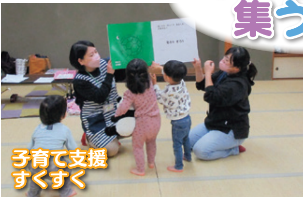
子育て支援 すくすく