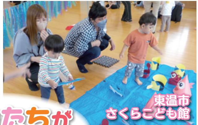
東温市 さくらこども館