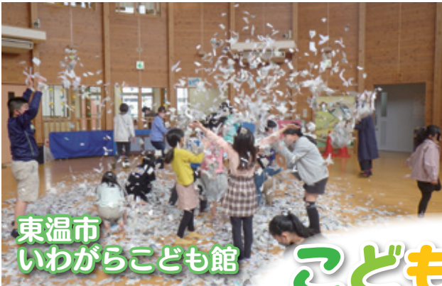
東温市 いわがらこども館