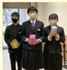
募金活動にご協力いただいた 重信中学校の生徒さん ▶