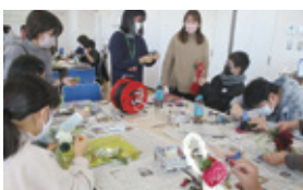
ボランティア活動

一般会費については、各地区を通じ納入いただいておりますが、地区で組入りがされていない方や特別賛助会員にご賛同いただけない方は、本会事務局までご連絡をお願い申し上げます。