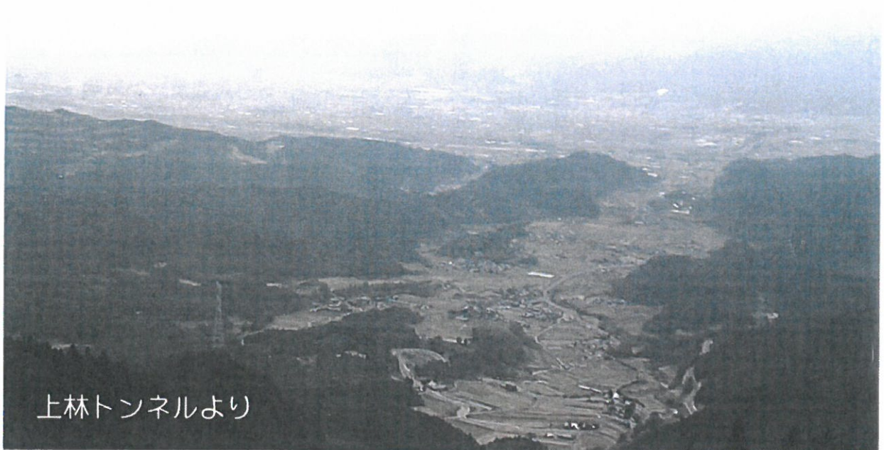
上林トンネルより