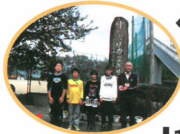
← 学校募金 (上林小学校)