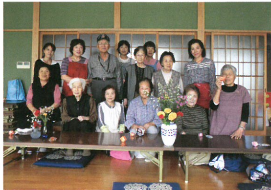
いきいきサロンねむの木