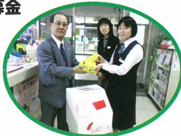
学校募金→ (重信中学校)