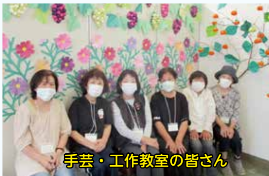
手芸・工作教室の皆さん